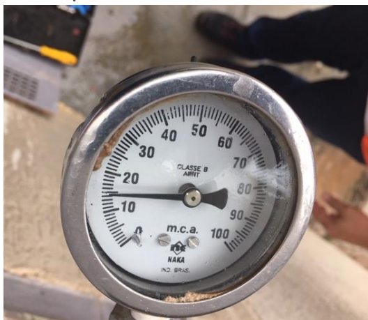
Rua Claudionor Borges, nº 40

Foram realizadas 05 (cinco) aferições em endereços aleatórios definidos pela ARMPF no momento da fiscalização.