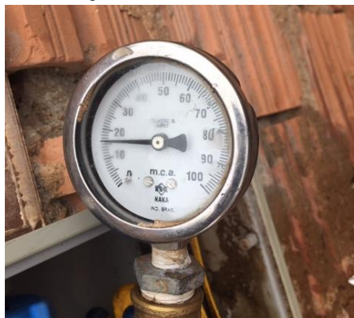
Rua Ângelo Utineti, nº 265