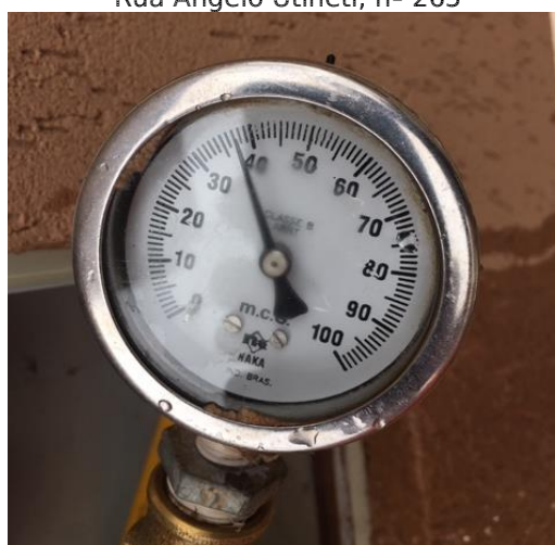
Rua Nelson Malaman, nº 30