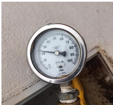
Rua Manoel J. Ribeiro, nº 405