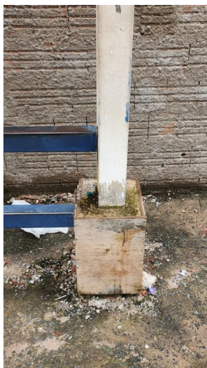
Foto 2 – base de sustentação com a presença de madeira na caixaria.

Constatamos a presença de um pequeno furo na cobertura do ponto