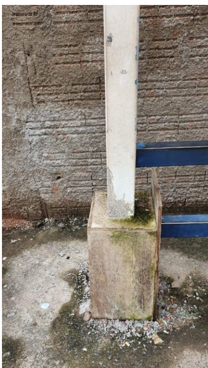
Foto 1 – base de sustentação com a presença de madeira na caixaria.

Constatamos que foi realizada concretagem da base de sustentação do ponto, contudo, a madeira utilizada na caixaria está presente no local.